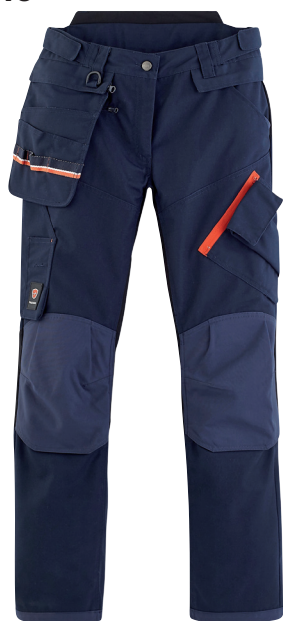
■ 1792 PARADE BLUE